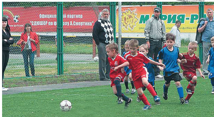
На Алтае появились поля не только хлебные, но и футбольные. Сколько детей стали борцами не только на футбольных полях, но и личностями, стремящимися к великим целям победы и уважения достоинства своих оппонентов.