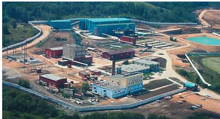
Во глубине Алтайских руд: разработка Зареченского месторождения с высоты птичьего полета.