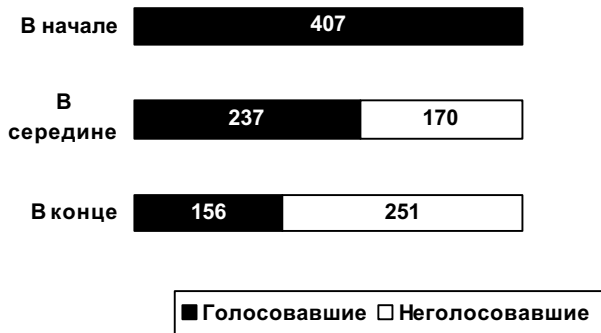
Диаграмма 1. Количество делегатов, участвовавших в работе съезда

В ходе регистрации утром 27 января было зарегистрировано 363 делегата. Затем, однако, новая мандатная комиссия, избранная съездом, фактически нарушила квоту, установленную Оргкомитетом для всех общественных организаций, предложив съезду зарегистрировать еще 44 делегата, избранных от 22 организаций, входящих в Народно-патриотический союз России.